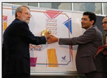
■ رونمایی از تمبر نمایشگاه کتاب تهران