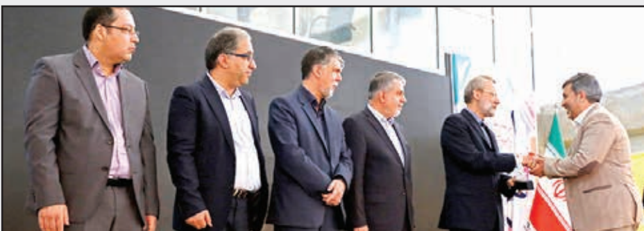
■ تقدیر از ناشران برگزیده