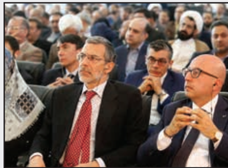
■ ایتالیا امسال مهمان ویژه نمایشگاه است