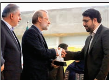
■ تقدیر از ناشران برگزیده