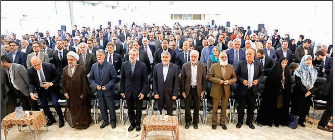
■ افتتاحیه نمایشگاه کتاب تهران