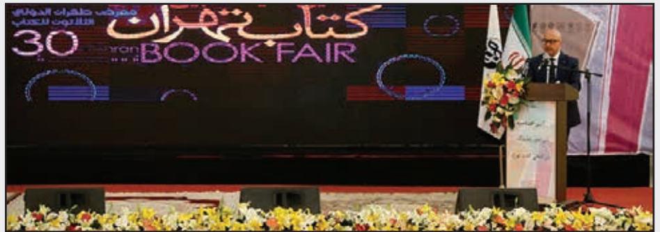
■ افتتاحیه نمایشگاه کتاب تهران