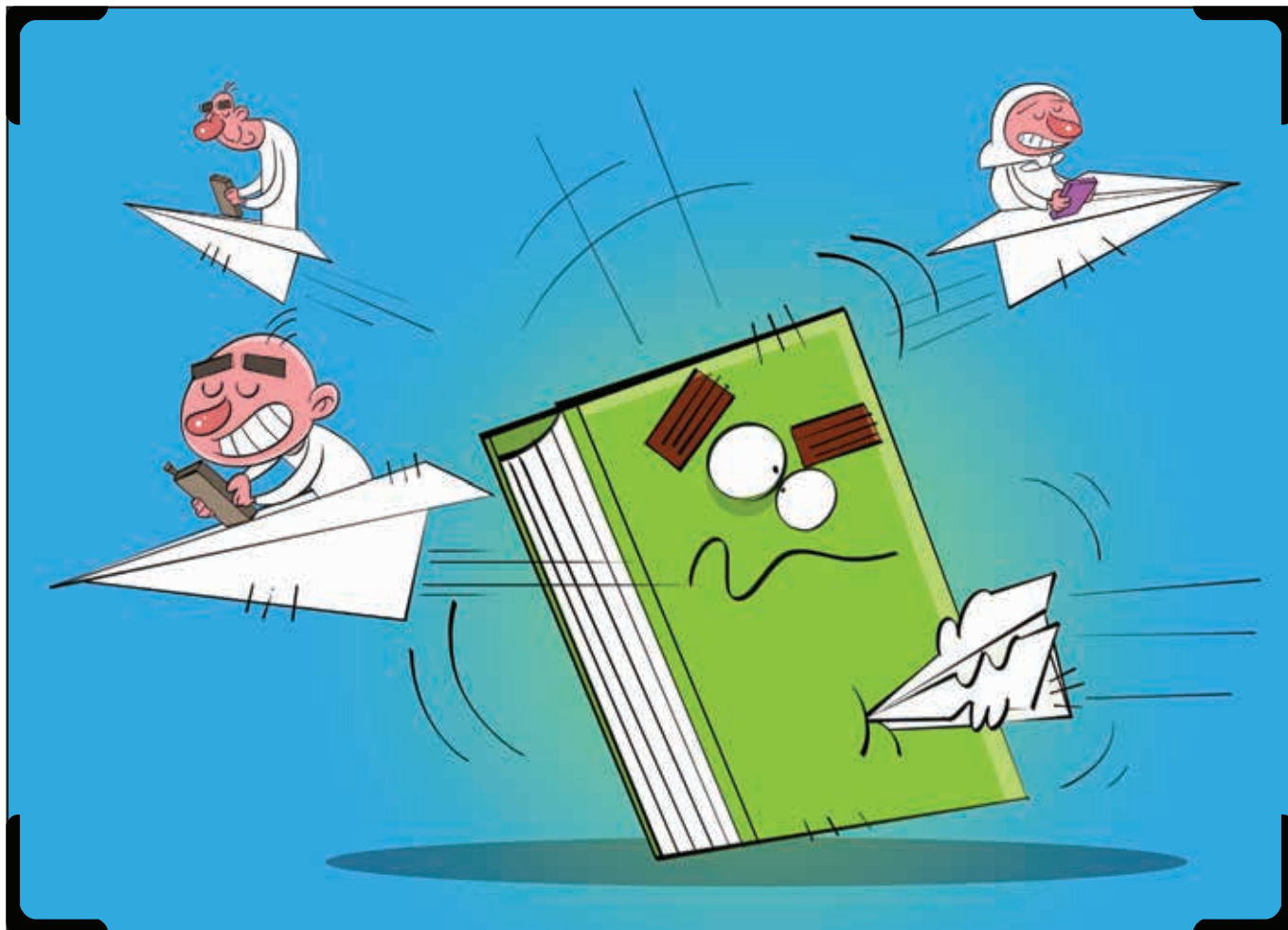
کارتون: رسول آذرگون