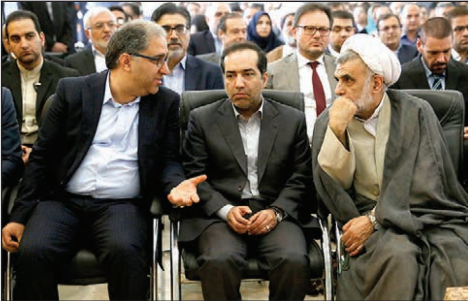
■ گفت و گوی وزیر فرهنگ و ارشاد اسلامی با رسانه ها در حاشیه ی افتتاحیه نمایشگاه کتاب تهران