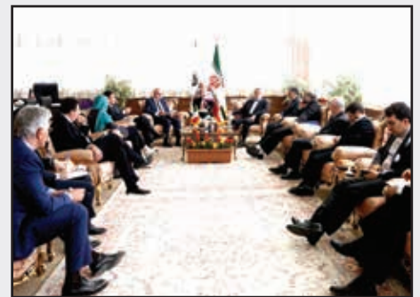
■ دیدار وزیر فرهنگ و ارشاد اسلامی با معاون وزیر فرهنگ ایتالیا