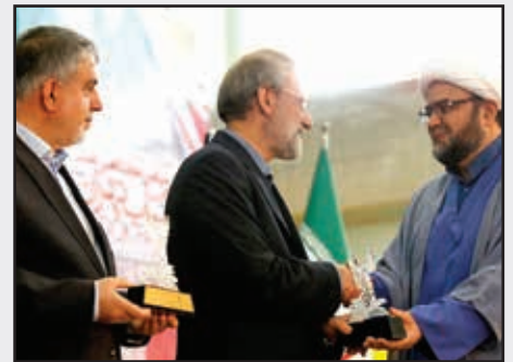
■ تقدیر از ناشران برگزیده