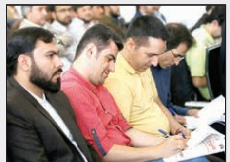
■ خبرنگاران در افتتاحیه