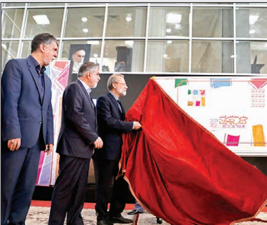
■ رونمایی از تمبر نمایشگاه کتاب تهران