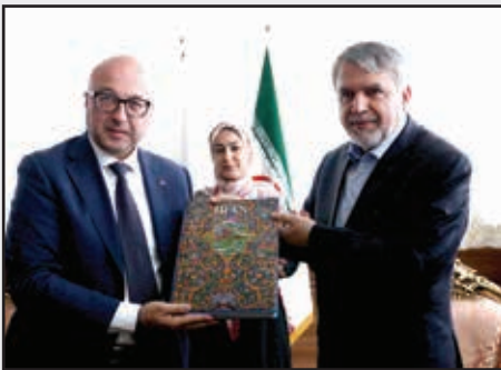
■ دیدار وزیر فرهنگ و ارشاد اسلامی با معاون وزیر فرهنگ ایتالیا