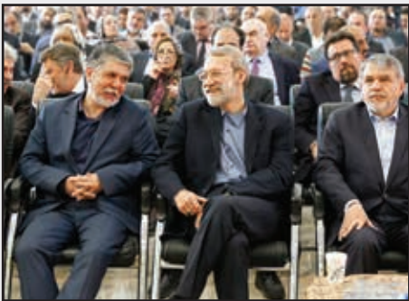
■ افتتاحیه نمایشگاه کتاب تهران