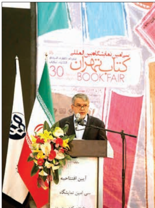
افتتاح سی امین نمایشگاه کتاب تهران